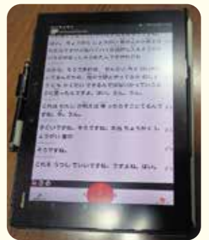
「UDトーク」とは、コミュニケーションを支援するアプリで音声で発した内容を文字としてタブレットの画面に表示するもの。

答弁: 学校教育で活用する際には、モニターに表示される文字のスピードや漢字のレベルなど、対象児童生徒の発達段階や障害の状況等を踏まえる必要がある。教員に対する使用は、業務として十分に活用できるか見極める必要があることから、引き続き検討してまいります。